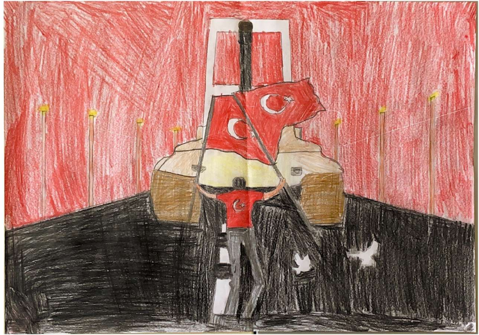
Ebrar KAYA 4/E