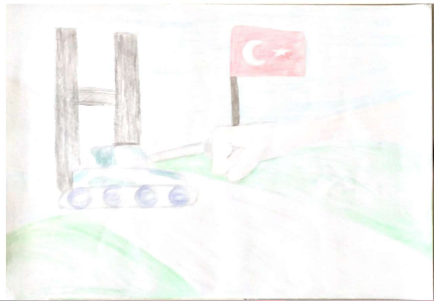
Nehir ÖZCAN 4/E