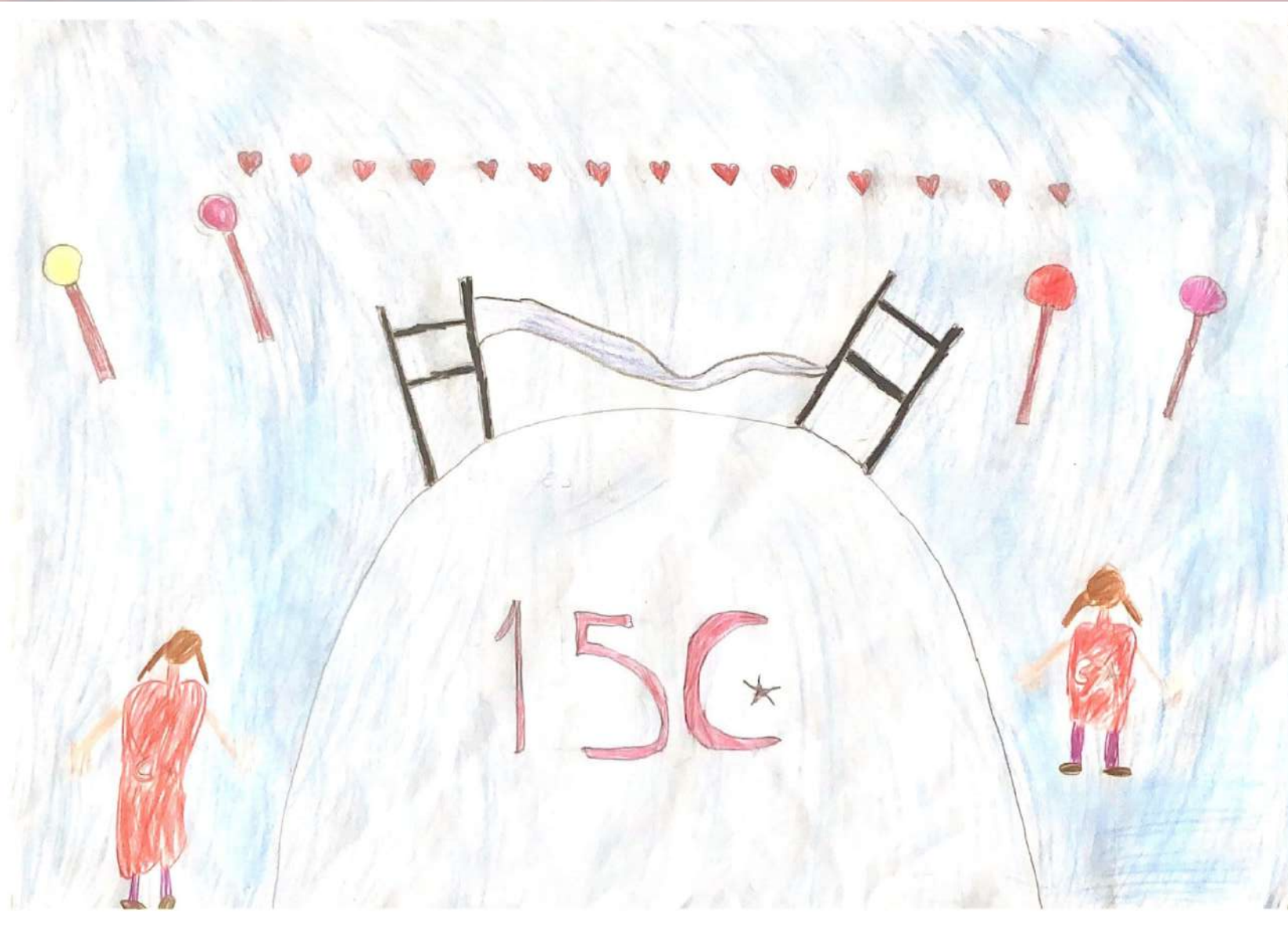
Ebrar KAYA 4/E